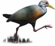
Saracura-três-potes Aramides cajaneus