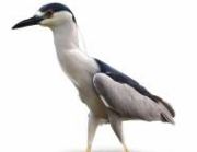
Savacu Nycticorax nycticorax