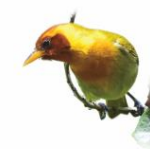
Sairá ferrugem Hemithraupis ruficapilla