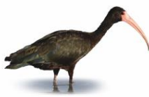
Tapicuru Phimosus infuscatus