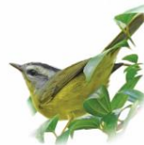
Pula-pula Basileuterus culicivorus