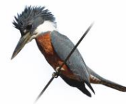
Martim Pescador Grande Megascops torquata