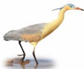
Maria Faceira Syrigma sibilatrix