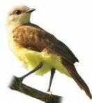
Suiriri-cavaleiro Machetornis rixosa