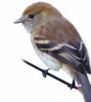
Filipe Myiophobus fasciatus