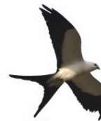
Gavião-tesoura Elanoides forficatus