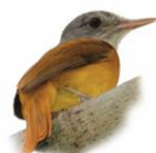
Capitão-de-saíra Attila rufus

www.costaverdemar.com.br www.ecoturismocostaverdemar.com.br