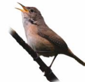
Corruira Troglodytes musculus