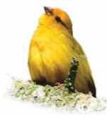
Canário-da-terra Sicalis flaveola