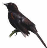
Encontro Icterus pyrrhopterus