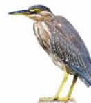
Socozinho Butorides striata