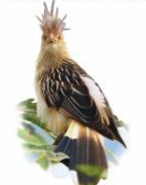
Anu branco Güira güira