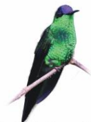
Beija-flor de Frente Violeta Thalaurania glaucopsis