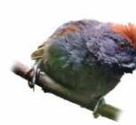
João teneném Synallaxis spixi