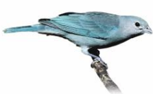
Sanhaçu Cinzento Tangara sayaca