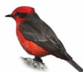
Príncipe Pyrocephalus rubinus