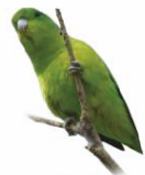
Tuim Forpus xanthopterygius