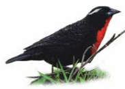
Polícia Inglesa Sturnella superciliosa