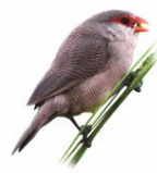
Bico-de-lacre Estrilda astrild