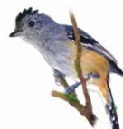
Choca-da-mata (fêmea) Thamnophilus caerulescens