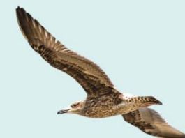
Gaivotão Larus dominicanus