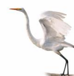
Garça Branca Grande Ardea alba