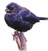
Tiziu Volatinia jacarina