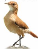
João-de-barro Furnarius rufus