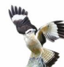
Carrapateiro Milvago chimachima