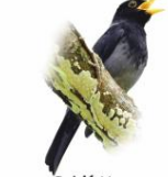
Sabiá Una Turdus flavipes