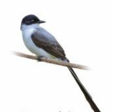
Tesourinha Tyrannus savana