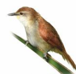
Curutié Certhiaxis cinnamomeus