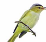
Juruviara Vireo chivi