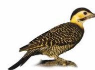
Pica-pau-do-campo Colaptes campestris