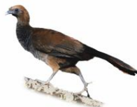
Aracuã-escamoso Ortalis squamata