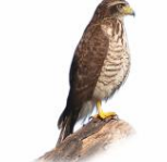
Gavião Carijó Rupornis magnirostris