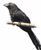
Anu-preto Crotophaga ani