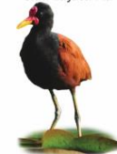
Jaçanã Jacana jacana