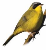
Pia-cobra Geothypis aequinoctialis